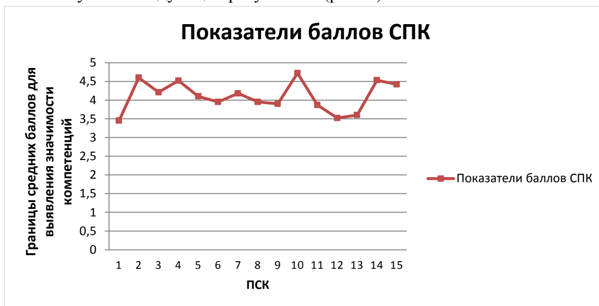
Рис. 1. Распределение баллов по СПК (1-15)

На основании проведенного исследования по диагностике значимости СПК получены следующие результаты (рис. 1).